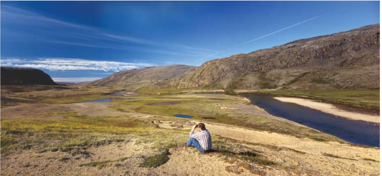
Nunavumi Pulaakatakviit ovalo Nutaat Nunait – Taiguaktakhat