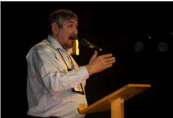
ወይንስተር ፍታራት ስብሰባ ላይ የሚያከላው ስነ-ምግባር ምክር ቤቅ የጥናታዊ ስነ-ምግባር ስብሰባ

ስብሰባ ስነ-ምግባር ስብሰባ ላይ የሚያከላው ስነ-ምግባር ምክር ቤቅ የጥናታዊ ስነ-ምግባር ስብሰባ