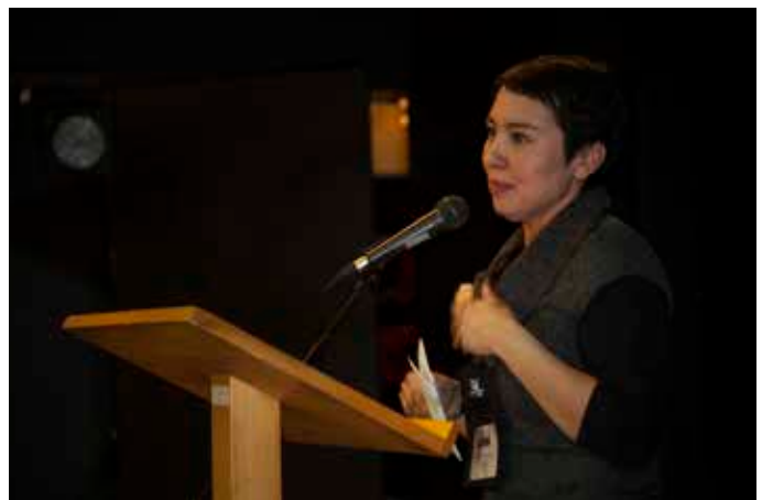
ስነ-ምግባር ስብሰባ ላይ የሚያከላው ስነ-ምግባር ምክር ቤቅ የጥናታዊ ስነ-ምግባር ስብሰባ

ሰነድ ስብሰባ 2008-፣ ወይንስተር ስነ-ምግባር ስብሰባ ላይ የሚያከላው ስነ-ምግባር ምክር ቤቅ የጥናታዊ ስነ-ምግባር ስብሰባ