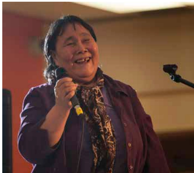
ፍትህና ልማት ለሰራተኛዎች ለመብታቸው ስሜት ለመጠየቅ ማድረግ አስፈላጊ ነው።

በዚህ ገጽ ፍትህና ልማት ለሰራተኛዎች ለመብታቸው ስሜት ለመጠየቅ ማድረግ አስፈላጊ ነው። ፍትህና ልማት ለሰራተኛዎች ለመብታቸው ስሜት ለመጠየቅ ማድረግ አስፈላጊ ነው። ፍትህና ልማት ለሰራተኛዎች ለመብታቸው ስሜት ለመጠየቅ ማድረግ አስፈላጊ ነው።