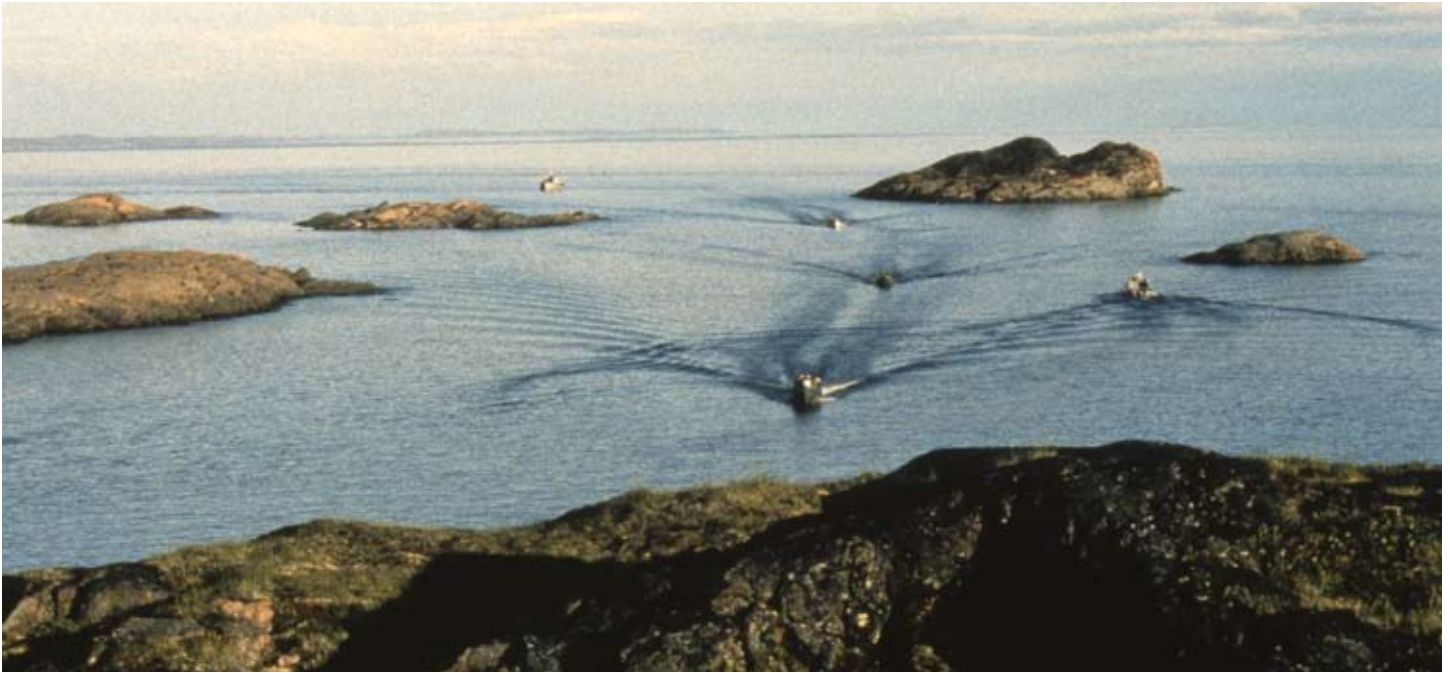
Nunavumi Pulaakatakviiit ovalo Nutaat Nunait – Taiguaktakbat

NUNAVUT PARKS ᐃᑦᑕᑦᑎᑦᑕᑦᑎᑦᑕᑦᑎᑦᑕᑦᑎᑦᑕ PARCS NUNAVUT