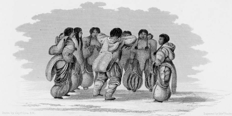
ESKIMAUX MAN DANCING.

ገጠና ላይ ለሚሰሩ ሰዎች ለሥራ ለሚሰሩ ሰዎች nuinnait ANGUT NUMIQTUQ ፍጥነት ላይ ለሚሰሩ ሰዎች ለሥራ ለሚሰሩ ሰዎች ለሥራ ለሚሰሩ ሰዎች Titirarhimayuq, Edward Finden 1800 ለሥራ ለሚሰሩ ሰዎች ለሥራ ለሚሰሩ ሰዎች 1900 atulihaalirhuni Esquimaux Man Dancing Esquimaux qui dansent Engraving, Edward Finden Gravure, Edward Finden Early 19th century Début du 19e siècle