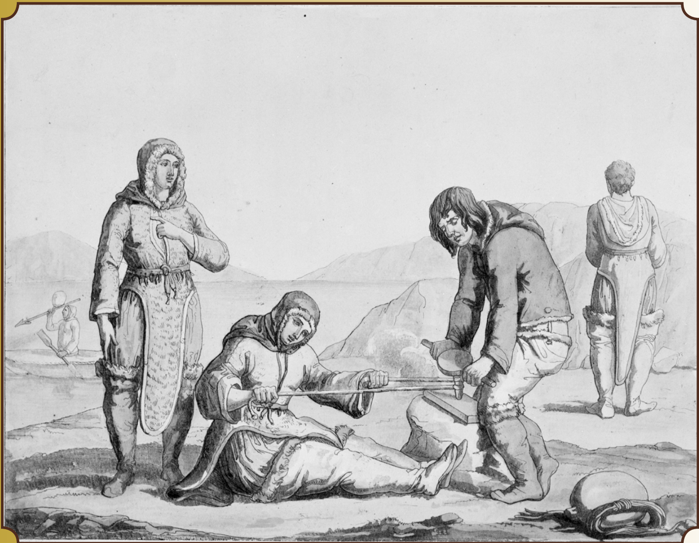
ԱՊՏԻՆՆԱԿ ՈՈԳԻՅԱԿԱՆՎՈՒՄԻՆԻՍՏԻԿ ՎԵՐՎՈՒՄԻՆԻՍՏԻԿ ՎԵՐՎՈՒՄԻՆԻՍՏԻԿ ԵՎ ՎԵՐՎՈՒՄԻՆԻՍՏԻԿ piksaliuqtaa kalalirhimayuq imaq imarmit kalaliurhimayuq, Bonatti Bramati 1800 ԼՈՒՆԱԿՆԵՐԵՆ 1900 atulihaalirhuni Eskimos Esquimaux Etching and aquatint with watercolour, Bonatti Bramati Eau-forte, aquatinte et aquarelle, Bonatti Bramati Early 19th century Début du 19e siècle