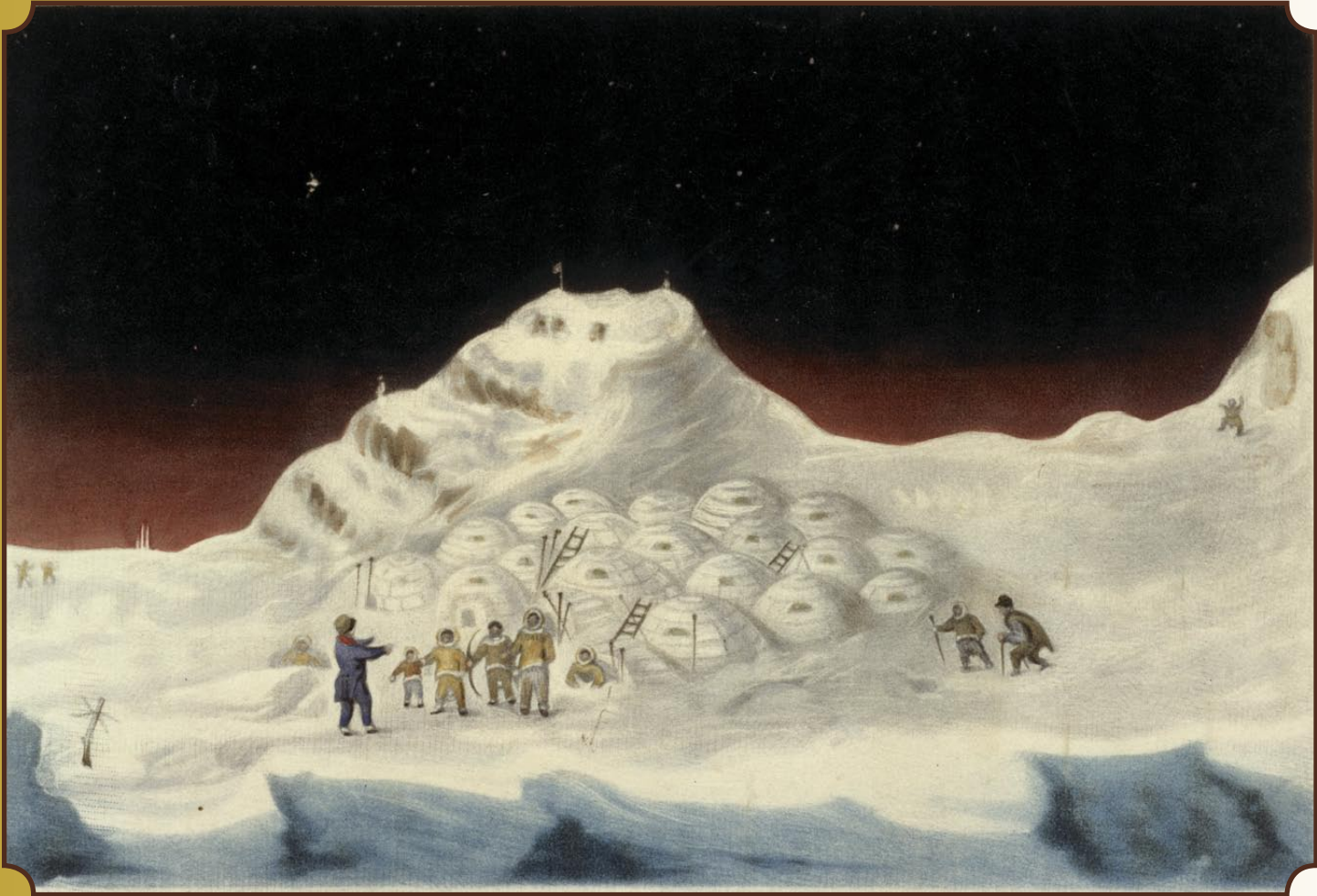
ጋጅ ገገጅጅ-ገ. ገገጅጅ ስጋጅጅ ገገጅጅጅጅ North Hendon. IGLUT BoothianMIUT ገገጅጅጅጅጅጅ ስጋጅጅጅ ገገጅጅጅጅ, ገገጅጅ ገጅ ገጅ Kalahimayumik titiraqhimayuq, Umiap ataninga John Ross 1834 North Hendon. Snow Cottages of the Boothians Igloos des Boothians à North Hendon Coloured engraving, Captain John Ross Gravure en couleurs, Capitaine John Ross 1834